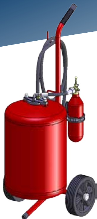
• TITAN 25Kg