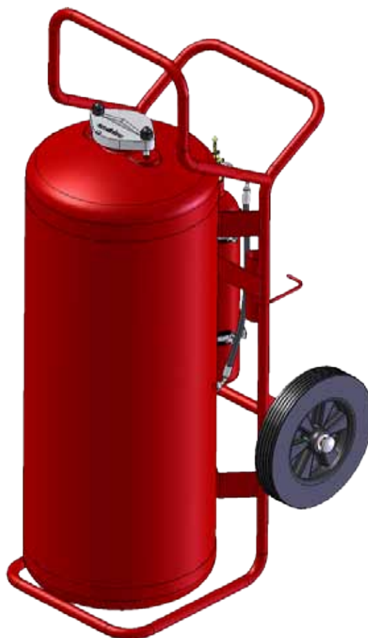
• TITAN 100Kg/95L