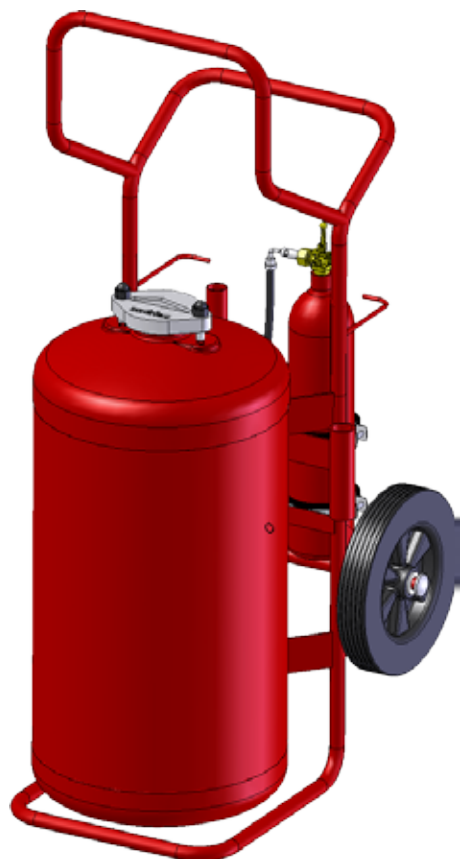
• TITAN 75Kg/70L