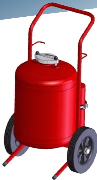
• TITAN 50Kg/45L